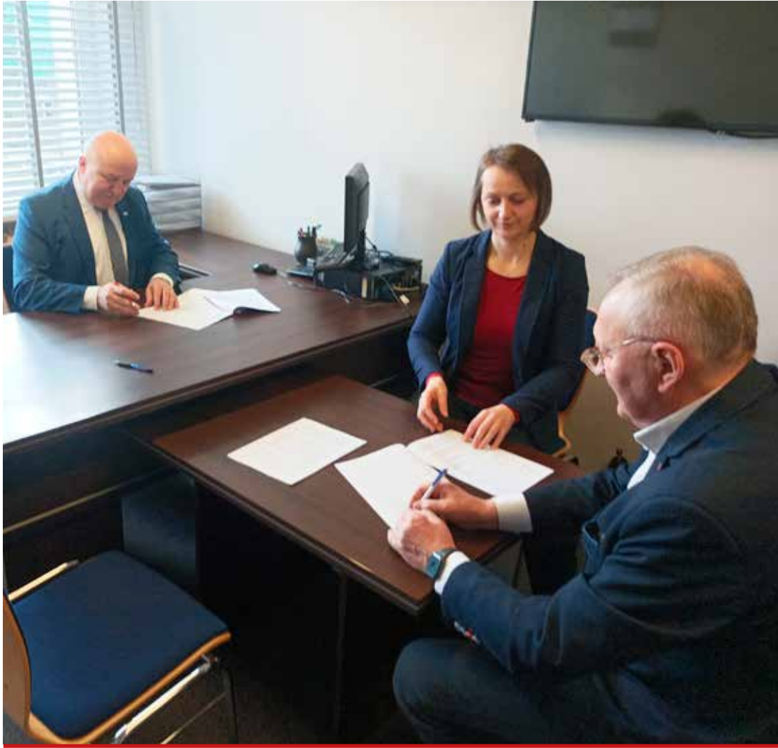
Podpisanie umowy na przebudowę ul. Wygoda w Baciutach. Roboty budowlane wykona Przedsiębiorstwo Robót Elektrycznych i Budowlanych MIPA Leon Stankiewicz.

Fundusz Wsparcia Gmin i Powiatów – gmina Turośń Kościelna z dofinansowaniem