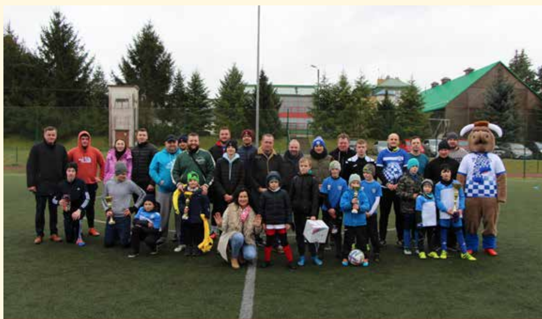
Pamiątkowe zdjęcie z Rodzinnego Turnieju Piłki Nożnej.