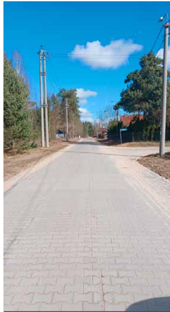
Ul. Leśna w Niewodnicy Koryckiej w kwietniu zostanie oddana do użytku.

Poza inwestycjami realizowanymi z Rządowego Funduszu Rozwoju Dróg zakontraktowane są także przebudowy dróg gminnych: drogi przez m.