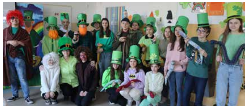
Zielone kapelusze, pomarańczowe brody, irlandzkie elementy – uczniowie w przygotowaniu strojów wykazali się dużą kreatywnością.