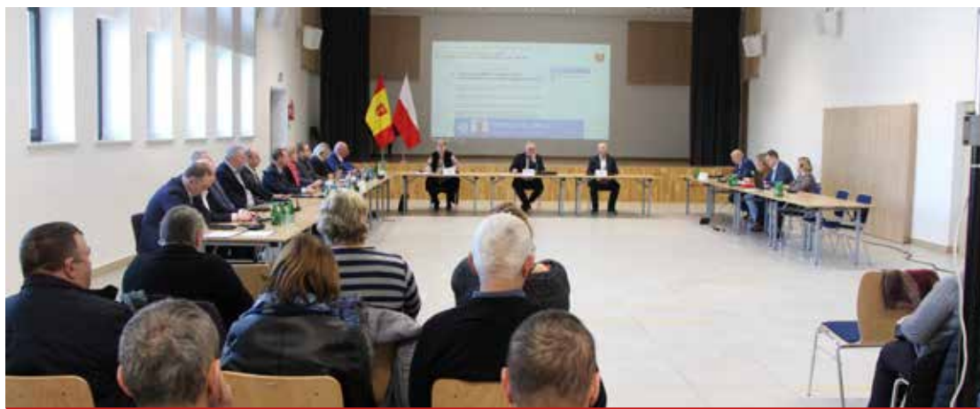
XLV sesja Rady Gminy Turośń Kościelna.