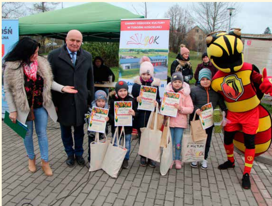
Laureaci Rodzinnego Konkursu na Palmę Wielkanocną wraz z Organizatorami.