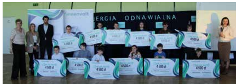
Uczniowie wykazali się niezwykłą świadomością konieczności dbania o środowisko.