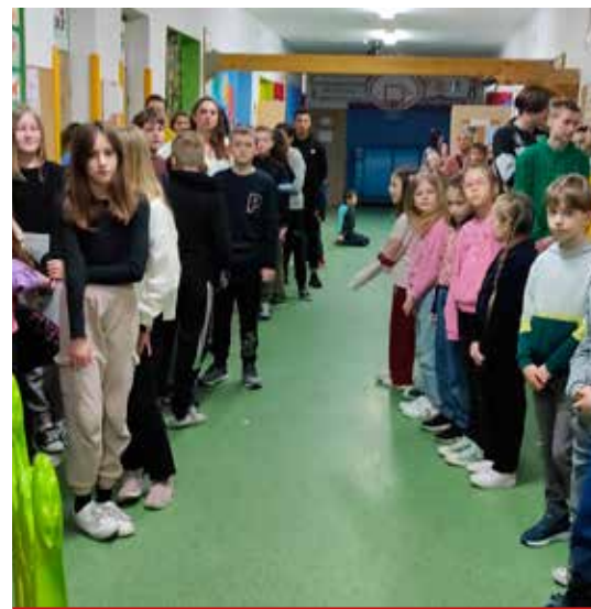
Szkoła zorganizowała m.in. Konkurs Historyczny pt. „Pamiętamy o Żołnierzach Wyklętych”.

„Błogosławieni, którzy nie widzieli a uwierzyli” J 20, 29