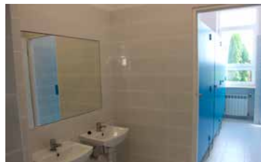
Odnowione łazienki będą służyć uczniom przez kolejne lata.