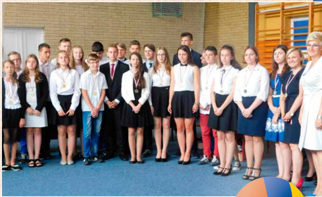
Uczniowie klasy V Szkoły Podstawowej w Turośni Kościełnej i III B gimnazjum otrzymali medale za najwyższą średnią.