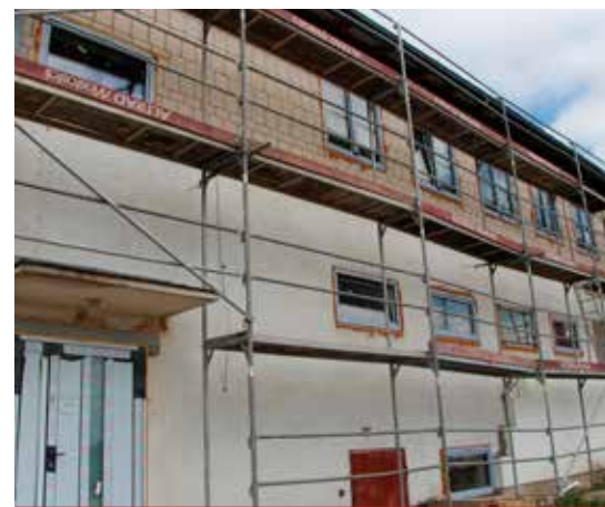
Modernizacja budynku na zewnątrz.