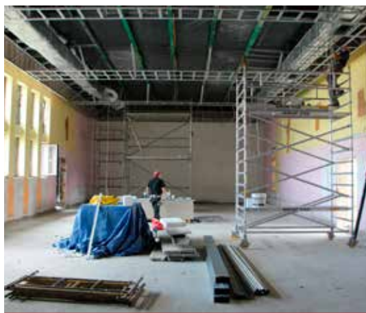
Salę główną w trakcie prac remontowych.

Krzysztof Dudziński