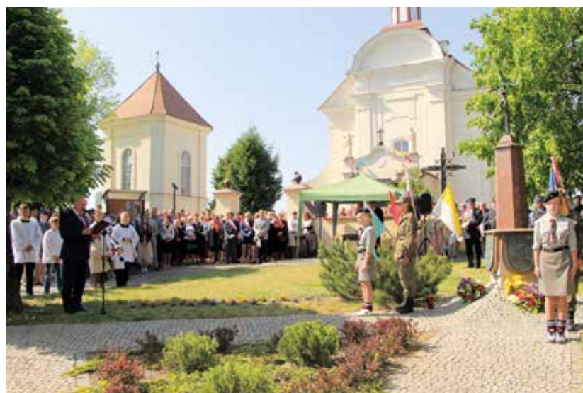
Jak żywa jest pamięć o znaczeniu Konstytucji Majowej świadczą obchody kolejnych rocznic.