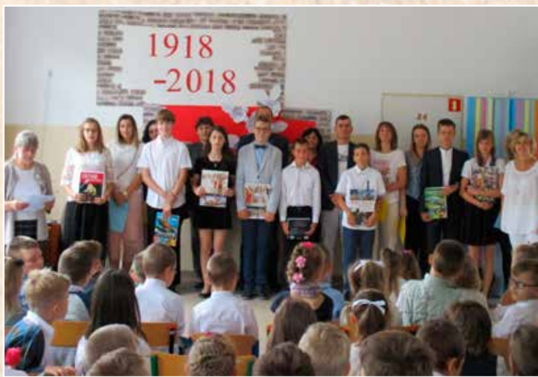
Wyróżnieni uczniowie klasy VI Szkoły Podstawowej w Tołczach z rodzicami.