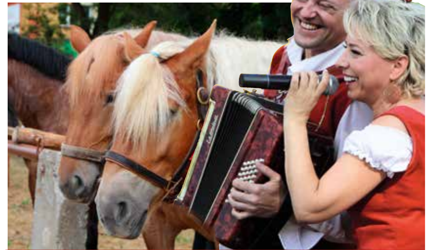
Celem imprezy jest promocja rozwoju obszarów wiejskich, zachowanie tradycji i dziedzictwa wsi podlaskiej, promowanie aktywnego wypoczynku, tworzenie sieci kontaktów i podnoszenie poziomu wiedzy oraz wymiana doświadczeń rolników i hodowców.