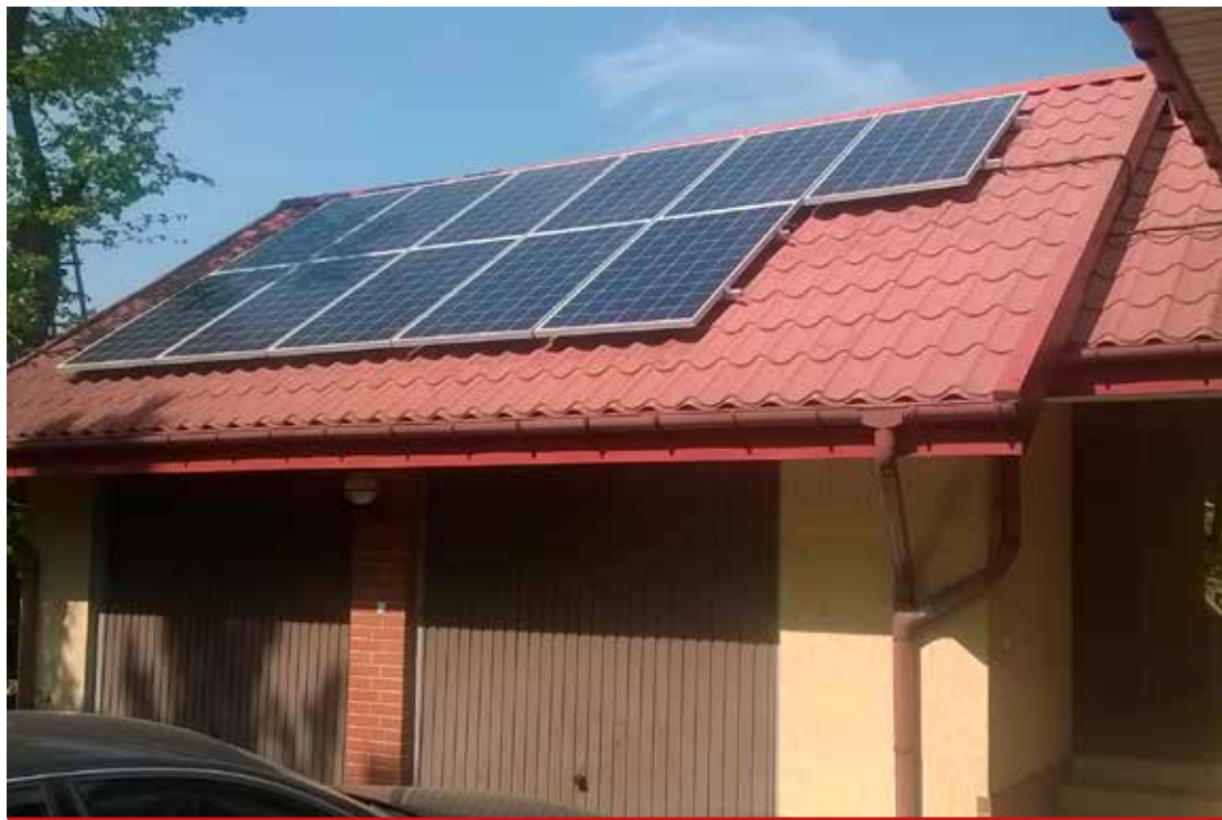
Zamontowane ogniwa fotowoltaiczne na jednym z budynków na terenie gminy.

Realizacja tego projektu pokazała jak na przestrzeni lat wrosło zainteresowanie mieszkańców energią odnawialną. Już po zakończeniu w 2016 r. naboru, w trakcie realizacji projektu oraz obecnie, wpływają do urzędu podania o dofinansowanie montażu, w głównej mierze kolektorów słonecznych. Z całą pewnością można stwierdzić, iż świadomość społeczeństwa w kwestii konieczności przedstawienia swoich gospodarstw domowych z energii konwencjonalnej na odnawialną jest coraz większa. Wynika to zapewne nie tylko z korzyści ekonomicznych, ale także z potrzeby dbania o nasze środowisko naturalne.