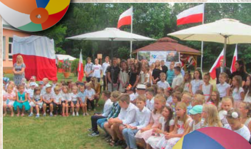
Kolejny rok nauki i pracy dobiegł końca. Na zdjęciu uczniowie niewodnickiej szkoły podstawowej.