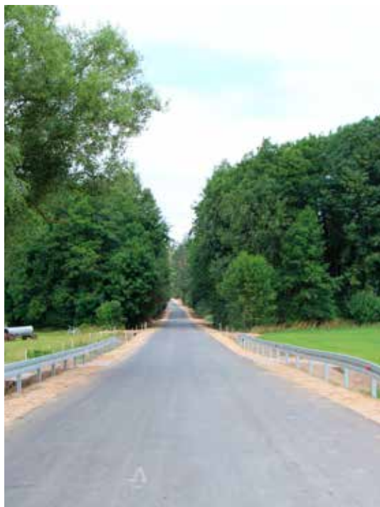
Droga Pomigacze – Lubejki