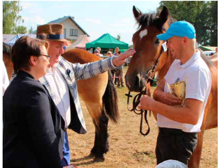
Konkursy koni kończą się wręczeniem pucharów oraz nagród. Gratulujemy wszystkim laureatom!