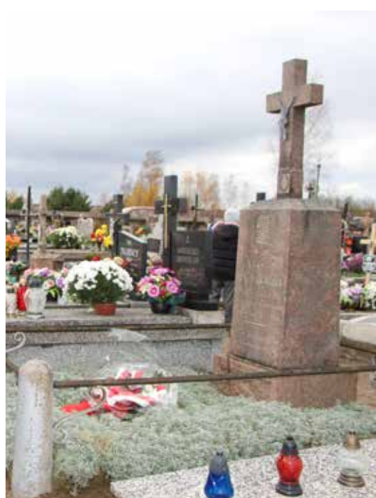
Mogiła Antoniego Powierzy na cmentarzu w Turośni Kościelnej przed renowacją.

Pamiętkowa mogiła Antoniego Powierzy z 1874 r., znajdująca się na cmentarzu w Turośni