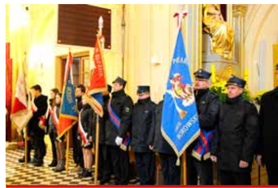
Jak co roku rangę uroczystości podniosły poczty sztandarowe.