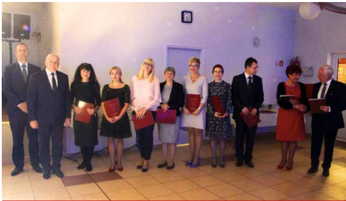
Pracownicy edukacji uhonorowani nagrodą wójta gminy. Gratulujemy i życzymy dalszych sukcesów w rozwoju młodych pokoleń!

14 października przypada Dzień Edukacji Narodowej. Święto powszechnie nazywane Dniem Nauczyciela, a tak naprawdę święto wszystkich pracowników związanych z oświatą. Na tę okoliczność 13 paź-