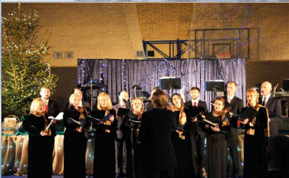
MediCoro skupia lekarzy-miłośników śpiewu chóralnego. Jego członkowie wywodzą się z chóru akademickiego białostockiego Uniwersytetu Medycznego. Piękne głosy prezentują publiczności już od dziesięciu lat.