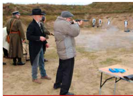
Umiejętność koncentracji oraz równomiernego wyciskania spustu daje szansę na zwycięstwo.