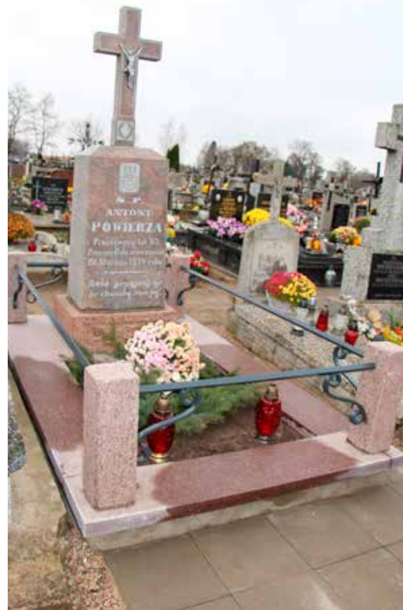
Pomnik po przeprowadzeniu prac renowacyjnych.