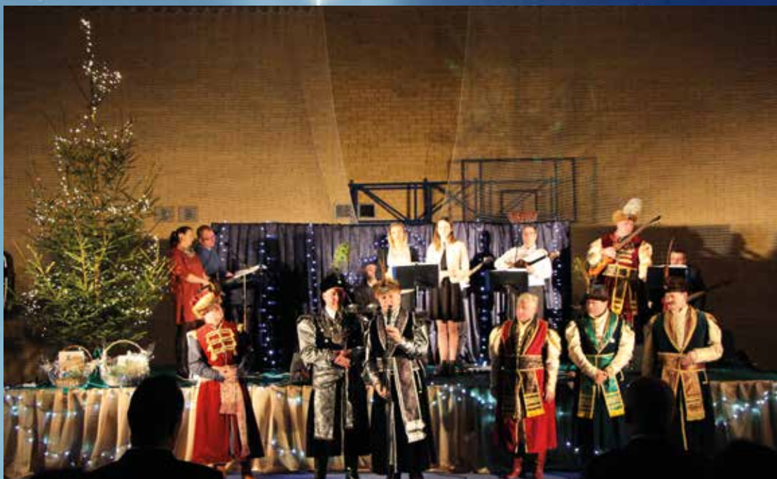
Łomżyńsko-Drohickie Bractwo Kurkowe Towarzystwo Strzeleckie z Ciechanowca przypomniało gościom tradycję Wigilijne. Młodzi mieszkańcy gminy może niektóre z nich słyszeli pierwszy raz. Urozmaicały je kolędy Bożej Nuty.