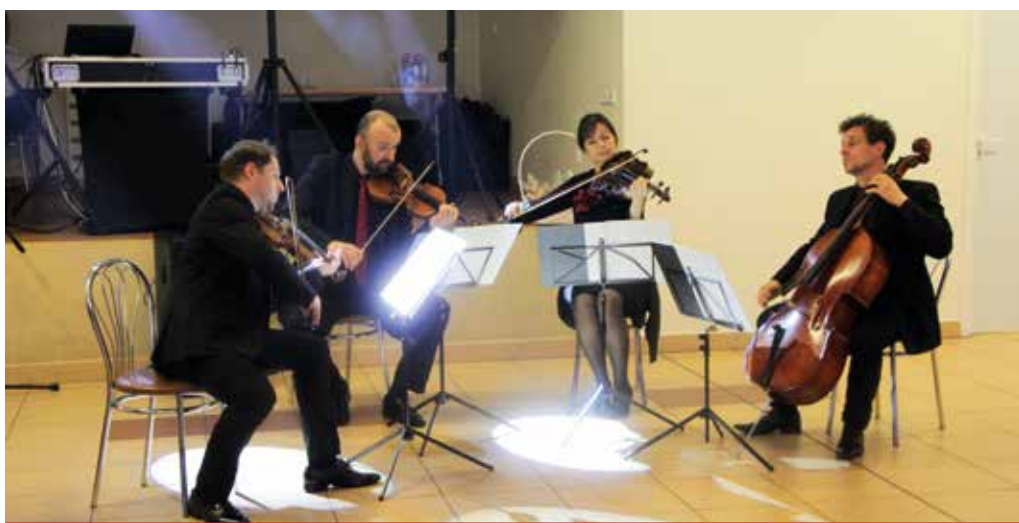
Kwartet Dworski tworzą muzycy Opery i Filharmonii Podlaskiej.