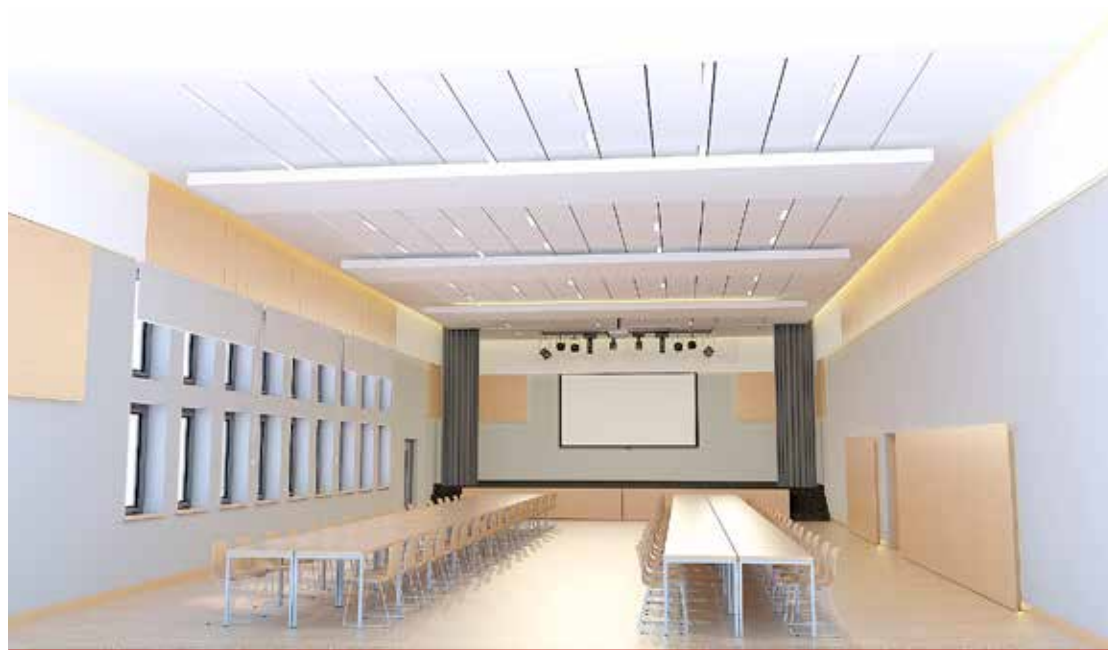
Projekt wizualizacji wnętrza remizy po renowacji.

Podczas kolejnego nadzwyczajnego zebrania 12 grudnia br. członkowie OSP Turośń Kościelna większością głosów zdecydowali, iż własność budynku i gruntu zostanie przeniesiona na rzecz gminy. Na potrzeby Ochotniczej Straży Pożarnej pozostanie część garażowa i socjalna.