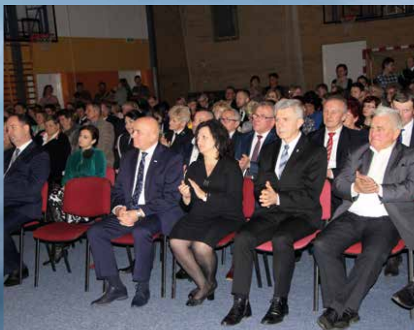
Frekwencja na sali dowodzi słuszności organizowania spotkań opłatkowych w gminie. Tegoroczna samorządowa Wigilia odbyła się już po raz piąty.