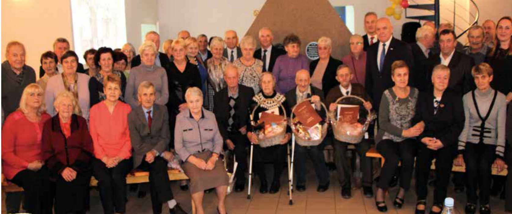
Celebrowanie każdego roku „Dnia Seniora” to już lokalna tradycja, a zarazem serdeczne podziękowania skierowane do dojrzałych i starszych mieszkańców naszej gminy.