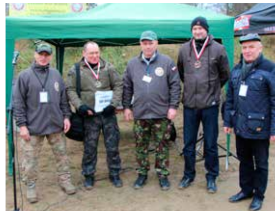
Organizatorzy pikniku patriotycznego ze zwycięzcami zawodów strzeleckich o puchar wójta gminy Turośń Kościelna.