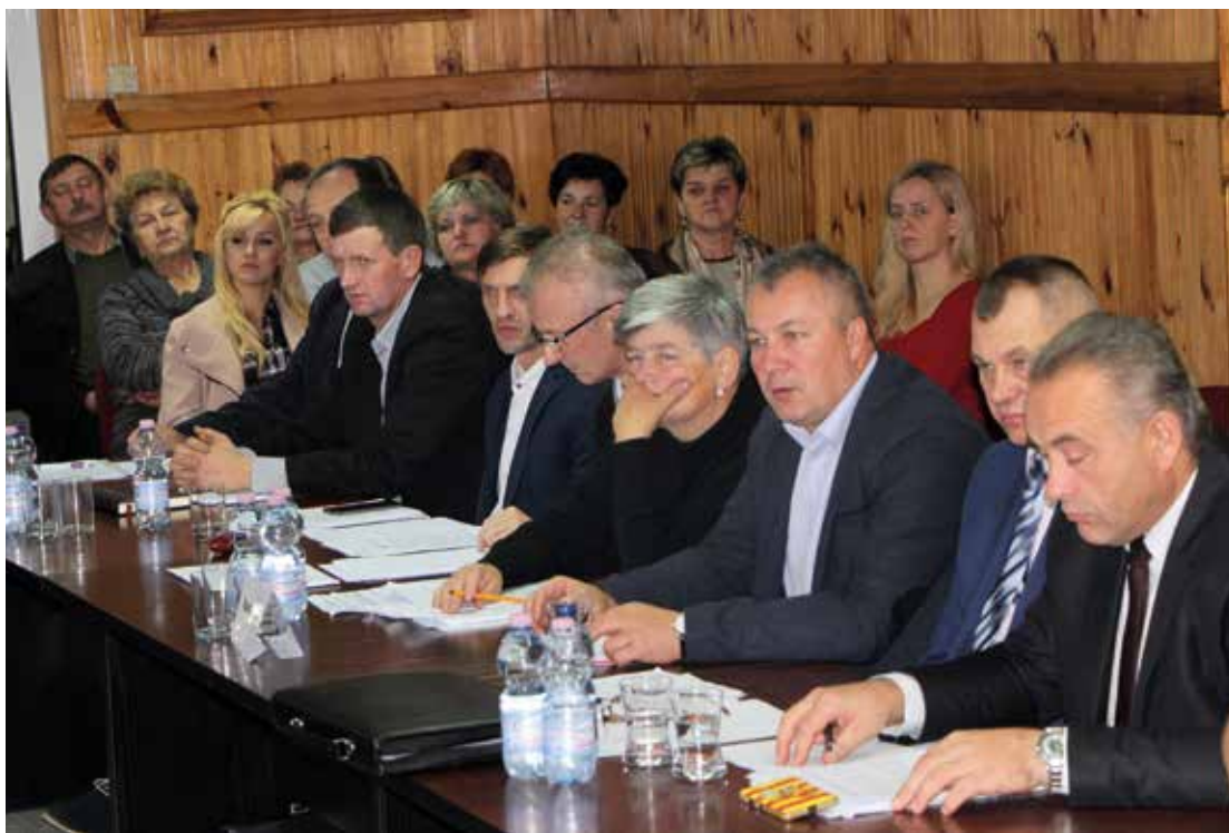
Radni i sołtysi podczas obrad XXVII sesji Rady Gminy Turośń Kościelna.

Jednogłośnie Rada Gminy przyjęła uchwałę zmieniającą uchwałę w sprawie przyjęcia „Regulaminu utrzymania czystości i porządku na terenie gminy Turośń Kościelna”. Jako JST jesteśmy zobligowani do stosowania uaktualnionych aktów normatywnych, jakim w tym zakresie są Rozporządzenia Ministra Ochrony Środowiska. Przepisy szczegółowe obligują gminę do nanoszenia korekt i zmian. Dotyczy to m.in. ujednoczenia