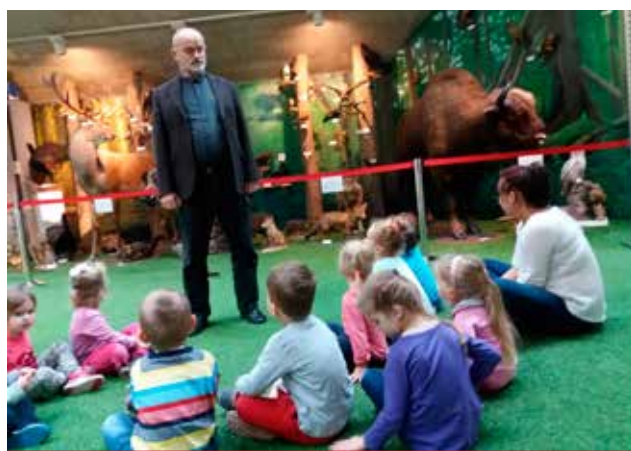
W pełnej zieleni sali można było spotkać zwierzęta na co dzień żyjące w naszym regionie.

A wszystko to w związku z realizacją projektu edukacji ekologicznej „Puchatek eko-badacz i przyjaciel przyrody” dofinansowanego z Wojewódzkiego Funduszu Ochrony Środowiska i Gospodarki Wodnej w Białymstoku.