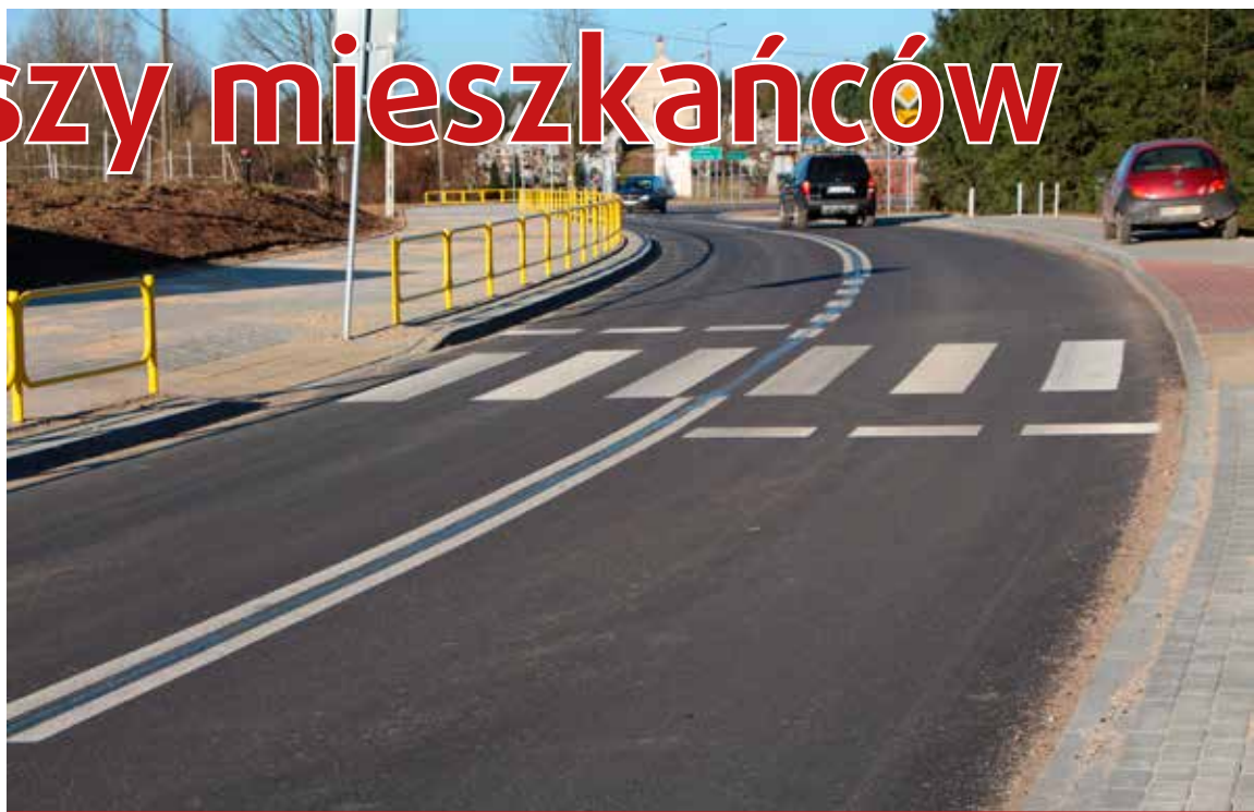
Widok na drogę od strony szkoły w Niewodnicy Kościelnej.