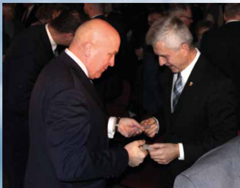
Bliżsi i dalsi znajomi. Albo całkiem obce osoby. Z opłatkiem w rękę wszyscy jesteśmy sobie bliscy. Zgody, wzajemnego szacunku i woli dążenia do wspólnych, szlachetnych celów życzyli gospodarze uroczystości.